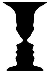
شکل ۱. گلدان، ادگار روبین ۳ (۱۹۱۵)

در تعریف این اصطلاح گشتالتی می‌توان گفت دریافت انسان به صورت خودکار همه صحنه‌ها را به دو بخش نقش و زمینه تقسیم می‌کند. نقش پدیده‌ای است که به دلیل مشخصه‌های پررنگ‌کننده، دارای شکلی غالب است و از لحاظ بصری ویژگی‌هایی دارد که زودتر دیده می‌شود. برای مثال متحرک است، در کانون قرار دارد، مدام تغییر می‌کند و به هر شکلی برجسته‌تر از بقیه صحنه عمل می‌کند (ر.ک: استاک‌ول، ۱۳۹۳: ۳۵). زمینه بخشی از صحنه است که باعث دیده شدن نقش می‌شود. برای مثال در شکل ۱، زمینه سفید به لحاظ بصری باعث دیده شدن نقش سیاه به عنوان گلدان می‌شود؛ در نتیجه گلدان «نقش» و صفحه سفید «زمینه» تلقی می‌شود. البته با تغییر زاویه دید و تمرکز بر نیم‌رخ دو انسان، می‌توان جای نقش و زمینه را در این تصویر تغییر داد و فضای خالی میان دو نیم‌رخ را زمینه سیاه در نظر گرفت.