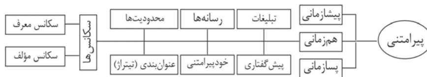
شکل ۲: طرح‌واره روابط پیرامتنی در سینمای ایران

همان‌طور که روشن است، روابط پیرامتنی پیچیده‌تر و بیشتر از روابط ابرمتنی هستند و در دل خود روابط مختلفی را جای می‌دهند. برای سهولت آشنایی با این روابط می‌توان از طرح‌واره زیر استفاده کرد: