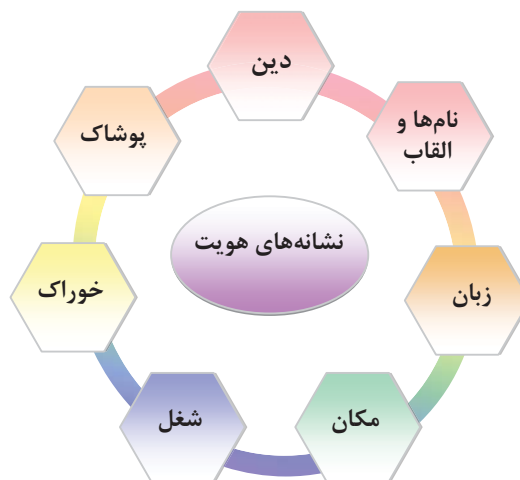
شکل ۱ نشانه‌های هویت در بیوتن

یا چندین مجموعه خاص و تفوق استثنایی آن‌ها در برهه‌ای معین است. پیوستگی امور اجتماعی نیز از نکاتی است که تعیین حدود مرزها را دشوار می‌کند (شعبانی، ۱۳۷۷: ۱۰۶). برای مثال، چگونگی خوردن صبحانه گاه نمودی از آداب معاشرت است و گاهی طبقه اجتماعی افراد، شرایط اقتصادی موجود آن‌ها و حتی هویت دینی‌شان را نشان می‌دهد (خوراک حلال و حرام مثال‌هایی از این موارد است). در بیوتن به هر سه جنبه از خوراک برمی‌خوریم. در مورد بسیاری از نشانه‌ها وضع همین‌گونه است. هویت نیز در بیوتن نمونه‌های مختلفی دارد؛ دین، لباس، نام‌ها و القاب، شغل‌ها، مکان‌ها و... (شکل ۱) نمونه‌هایی از این موارد است که در ادامه بررسی می‌شوند.